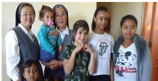
ラールアントニオの子どもたち