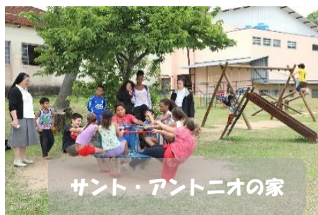
サント・アントニオの家