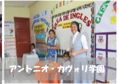
アントニオ・カヴォリ学園

イエスのカリタス友の会の皆様、主の降誕のお喜びを申し上げます。皆様いかがお過ごしでしょうか。ペルーは例年より涼しい夏を迎えています。