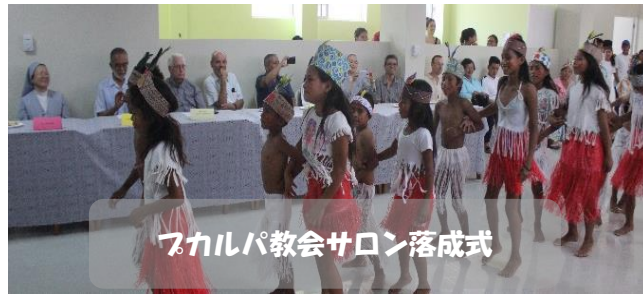
プカルパ教会サロン落成式