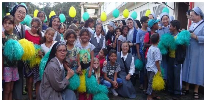
国際会議参加者と子どもたち