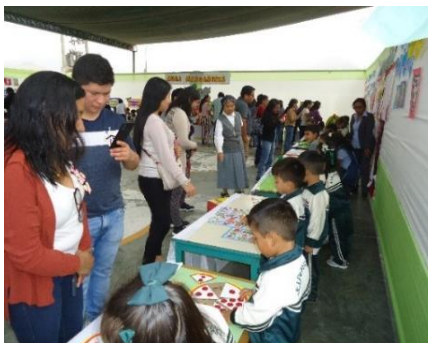
マリア・タキ保育園学習発表会