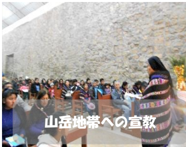
山岳地帯への宣教