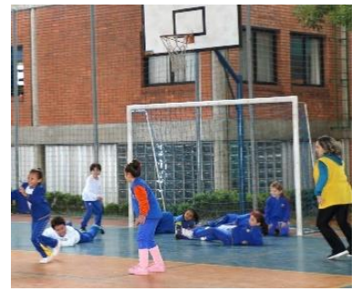
カリタス学園 サン・マテウス校

カリタス学園は、教育施設として教育の充実に最善を尽くしながら、かつ社会問題に対する生徒の関心を呼び覚まし、良い市民になれるよう教育することを大切にしています。自分の持ち物はそんなに多くなくても、その中からもっと貧しい生活をしている人々と分かち合うことを学びます。学校を支援して下さる方々のおかげで私たちの教育活動も可能となり、神様がお望みになる「すべての人々が豊かに生きること」というみ言葉の実現へと進むことができます。幼子イエス様のご生