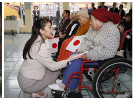
内親王眞子様訪問