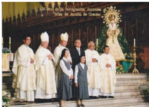
日本人ペルー入植100周年記念